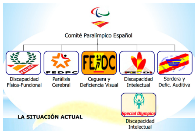
Tabla 1.2. Estructura del Comité Paralímpico Español

Las Federaciones Polideportivas buscan fomentar la practica del deporte por las personas con discapacidades con el objetivo de contribuir a una plena integración social.