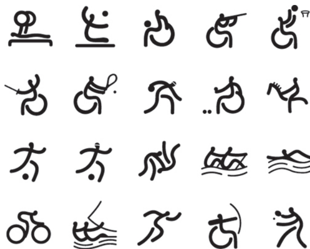
Figura 1.5. Disciplinas deportivas paralímpicas

En la consecución y trabajo de este proyecto, se va a llevar a cabo la investigación de la natación adaptada. El deporte que va a sustentar el reportaje deportivo que se va a llevar a cabo.