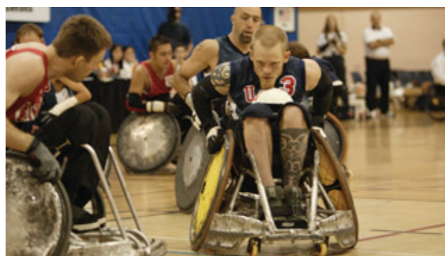
Figura 2. “Murderball” Henry Alex Rubin, Dana Adam Shapiro

Además, Murderball narra cómo estos deportistas sufrieron la desgracia de quedar parapléjicos.