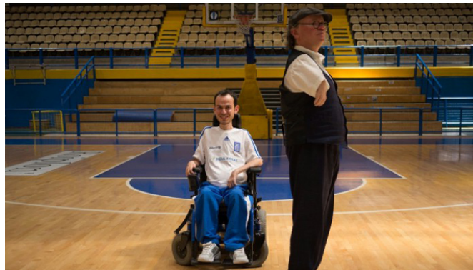
Figura 1.7. Niko von Glasow “ Camino a Olímpia ”

Los deportistas reflejan el sufrimiento, la dureza de practicar deporte y el entusiasmo de alcanzar la meta.