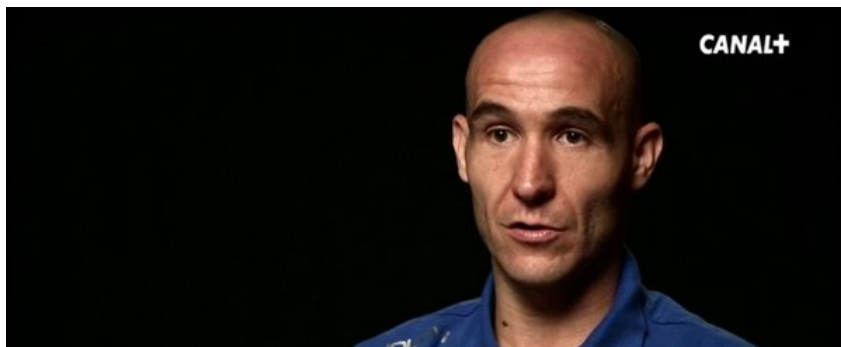
Figura 2.4. Análisis estético “Informe Robinson”

Buscar la sencillez, la persona que habla va a contar una vivencia profunda, una experiencia por lo tanto solo nos tenemos que centrar en eso.