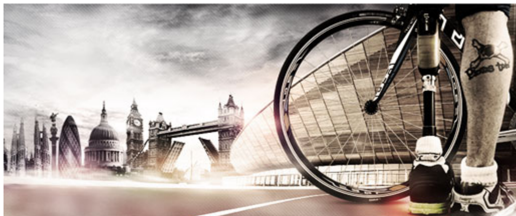
Figura 1.8. Documental “ Imparables ”

“ La teoría del espiralismo ” es un documental dirigido por Mabel Lozano donde las protagonistas son cinco deportistas paralímpicas que se muestran tal y como son, con sus aspiraciones, su entrega y su deseo de superación como cualquier otro deportista de élite. La película muestra la vida diaria de estas cinco deportistas de élite que luchan con todo su esfuerzo y no se ven menos a pesar de su discapacidad.