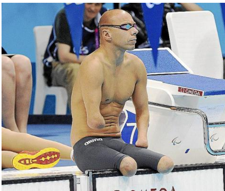
Figura 1.6. Xavi Torres, nadador paralímpico