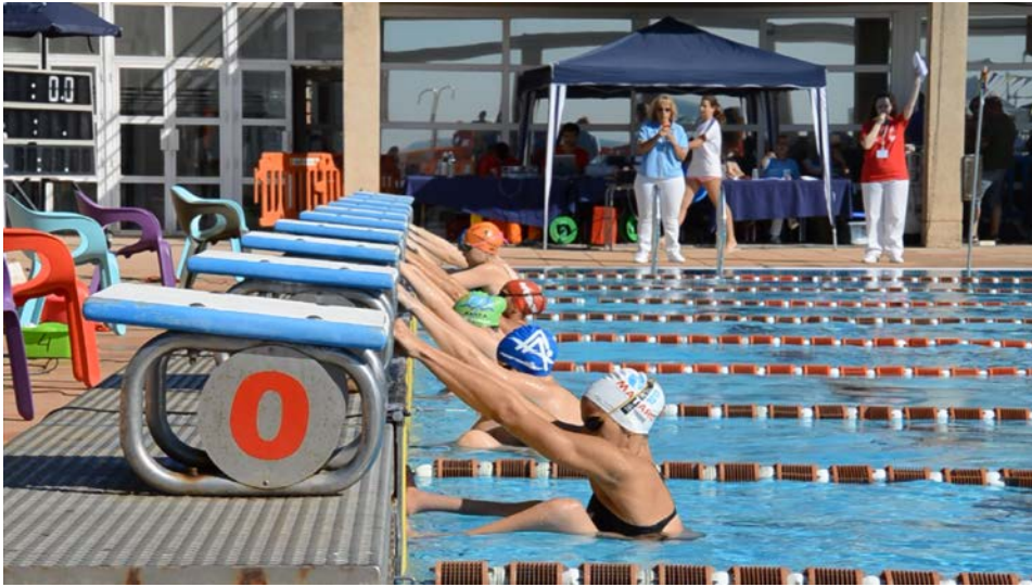
Figura 2.6. Campeonato de España de natación adaptada