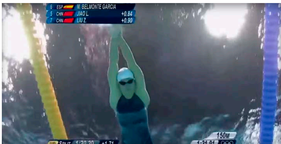
Figura 2.5. Análisis estético, imágenes acuáticas

Otro factor a tener en cuenta y que le va a dar una gran riqueza al reportaje va a ser el uso de imágenes acuáticas, que van a ser grabadas con GoPro Hero 4 . Lo que se busca con estas imágenes son los pequeños destellos de espectacularidad, no abusar de ellos, simplemente introducirlos cuando se crea necesario, para romper un poco con el ritmo del reportaje.