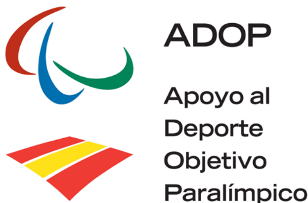
Figura 1.3. Apoyo al Deporte Objetivo Paralímpico (ADOP)

Existe un plan de apoyo para los deportistas con discapacidad, Apoyo al Deporte Objetivo Paralímpico (ADOP). Este proyecto es una iniciativa que busca proporcionar a los deportistas paralímpicos españoles unas mejores condiciones para que puedan llevar a cabo una mejor preparación a la hora de participar con el Equipo Español en los Juegos Paralímpicos.