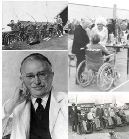
Figura 1. Ludwig Guttman

En 1960 Guttman organizó los primeros Juegos Internacionales, esta vez fuera de Stoke Mandeville, y se llevaron a cabo en Roma, donde coincidieron con los Juegos Olímpicos de ese año. Estos fueron los primeros Juegos Internacionales para discapacitados, en los cuales participaron 23 países y 400 deportistas en silla de ruedas, que compitieron en 13 deportes como fueron el atletismo, baloncesto en silla de ruedas, natación, esgrima, entre otros.