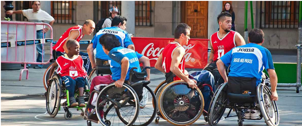
Figura 1.4. Integración social a través del deporte