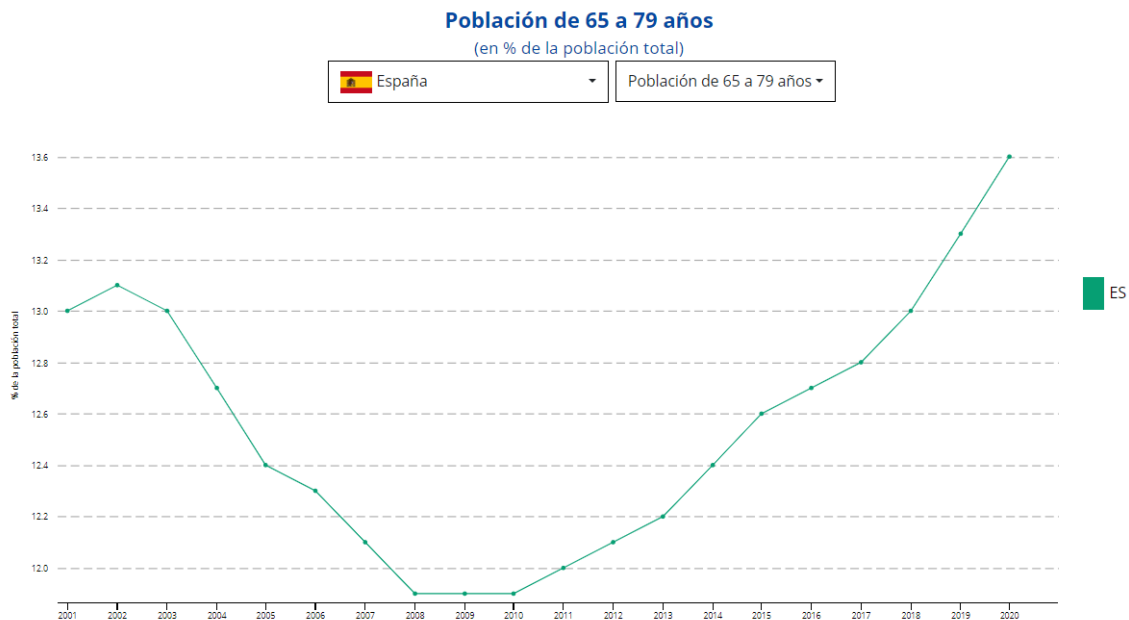
Fig. 2.2.1.1. Gráfica de la población española entre los 65 y 79 años.

En la siguiente gráfica obtenida del Instituto Nacional de Estadística (INE, 2022) se puede observar el crecimiento de la última década respecto a la población española comprendida entre los 65 y los 79 años, mostrando una de las cifras más altas con un 13,6% de la población española comprendida entre ese rango de edad.