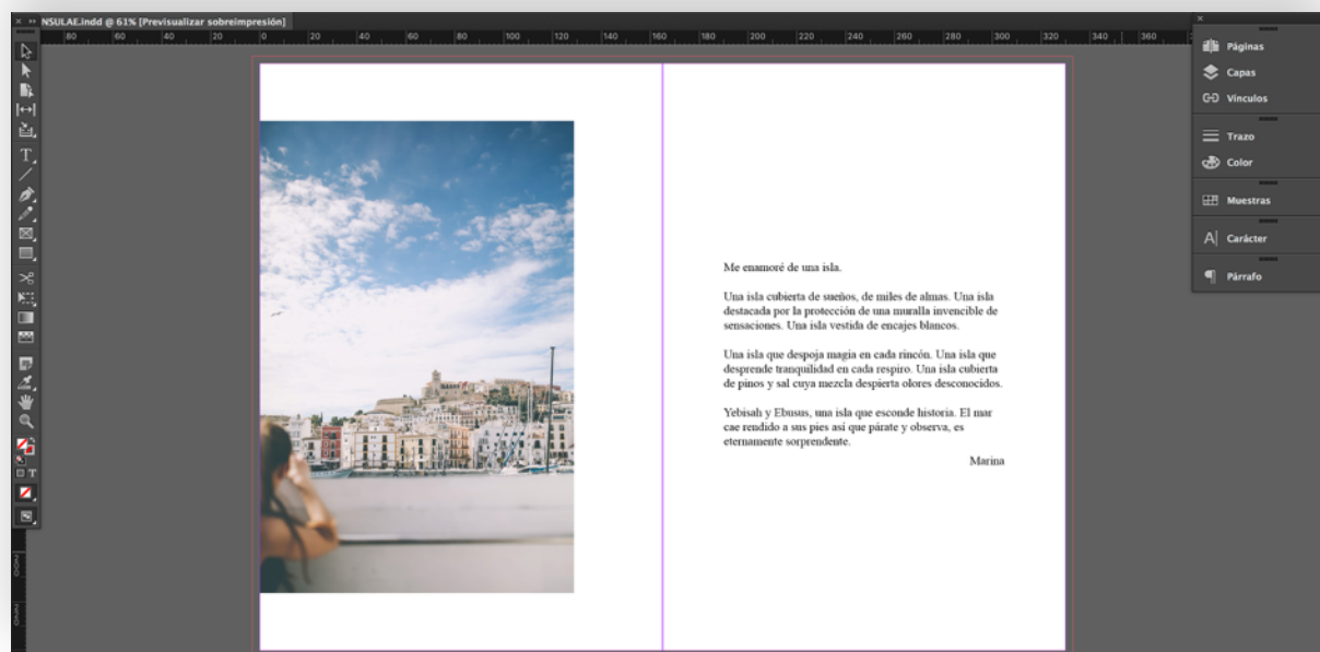
Figura 5.2 Captura software de maquetació

Un altre punt a destacar en el procés de maquetat és la disposició de les fotografies i l'estructuració de les mateixes en l'espai de què es disposa. Per això, han estat necessaris els processos de selecció esmentats anteriorment, a través dels quals, s'han obtingut les imatges finals a incorporar al llibre fotogràfic. A continuació doncs, s'ha pogut donar lloc a la disposició de les imatges tenint en compte un plantejament innovador i diferent en què la composició de les imatges es troba fora dels cànons establerts, en busca d'un nou punt de vista i narrativa visual atractiva pel lector.