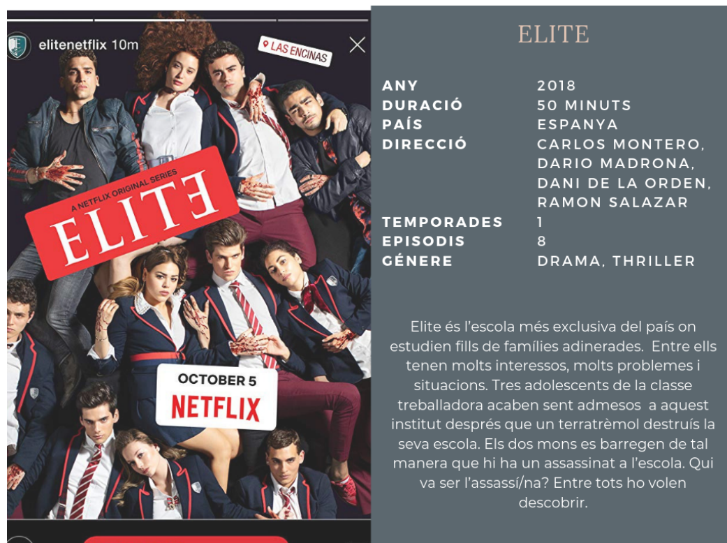
Figura 3. Fitxa tècnica Elite . Font: Elaboració pròpia