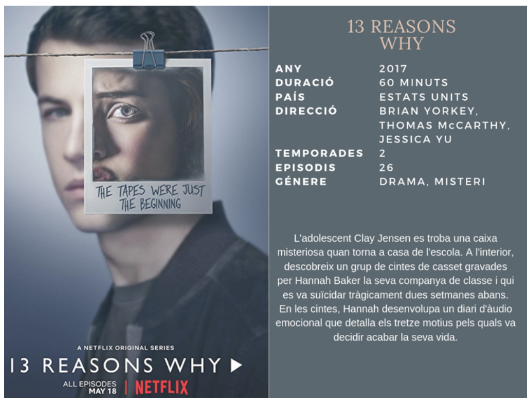
Figura 1. Fitxa tècnica 13 Reasons Why .

Aquesta proposta abasta una sèrie de produccions que són bastant recents i no s'han trobat estudis previs sobre aquestes. A més, l'esquema analític és una adaptació a un utilitzat amb anterioritat, i per tant, la unitat d'anàlisi i les seves categories poden generar una nova manera d'analitzar la sexualitat en sèries adolescents. En les fitxes en les figures I, II i III es resumeixen els trets característics de les tres teen series escollides: