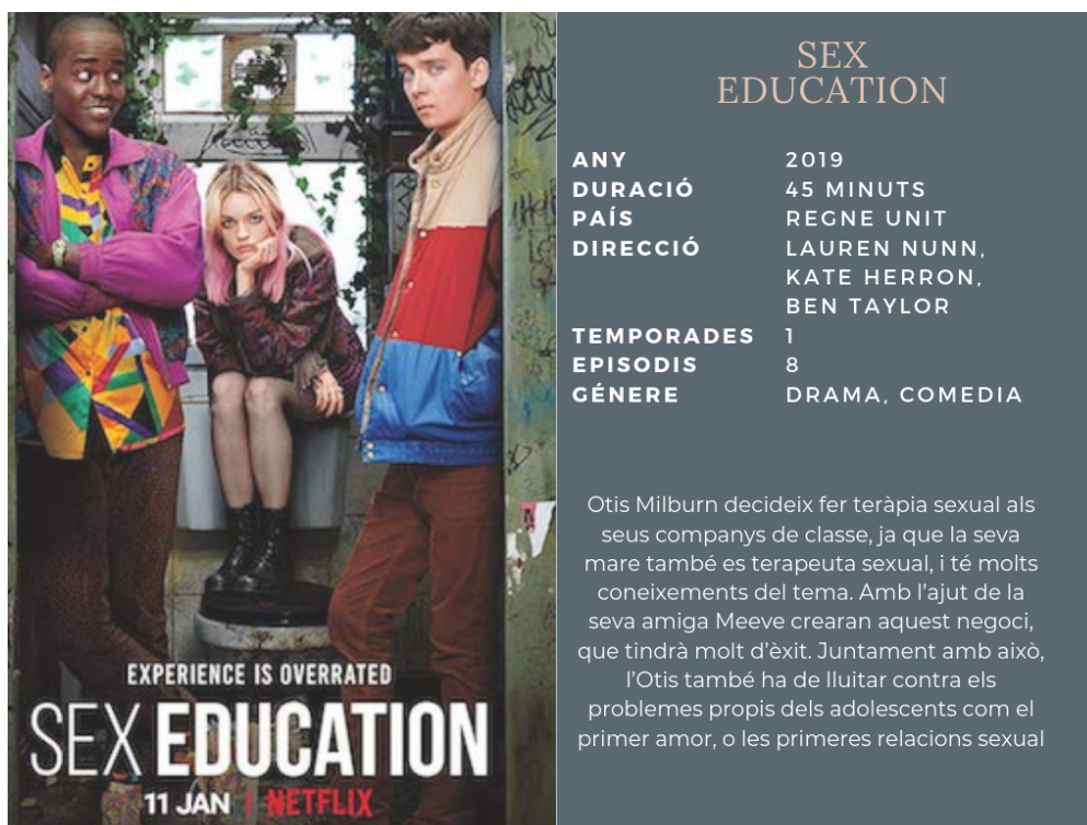
Figura 2. Fitxa tècnica Sex Education . Font: Elaboració pròpia